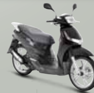
Jet Black (M7) 125