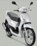
Iron Grey (M8) 125