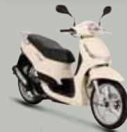
Dune (M9) 125