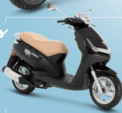
Noir Nacré (NK) 125