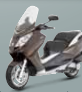
Bronze ( M6 ) 125