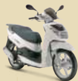
Cotton White (M2) 125 • 200i