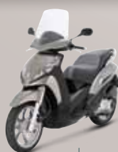
Havane (H8) 125 • 300 • 400