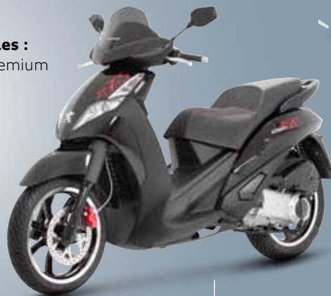
Noir Nacré / Noir Mat (NK) 125 • 300 • 400

versions disponibles : 125 - 300 - 400 Premium