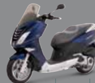
Midnight Blue (K1) 125