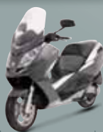
Gris Quartz ( J1 ) 125 • 250 400 • 500