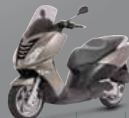
Havane (H8) 125