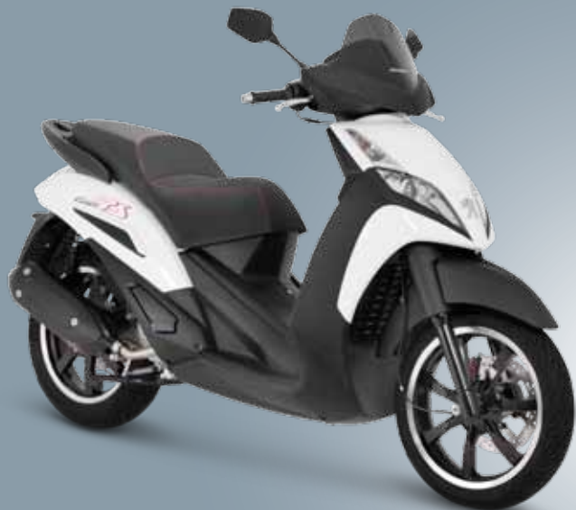
Blanc Neige / Noir Mat (BL) 125 • 300 • 400

versions disponibles : 125 - 300 - 400 Premium