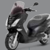
Noir Nacré (NK) 125