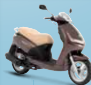
Chocolat (K2) 125