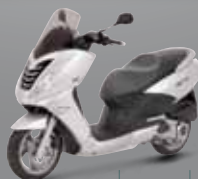
Technium Verni (TV) 125