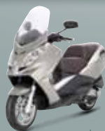
Havane ( H8 ) 125 • 250 400 • 500