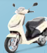
Ivory (J3) 125