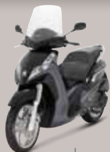
Noir Nacré (NK) 125 • 300 • 400