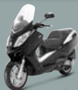
Noir Nacré ( NK ) 125 • 250 400 • 500