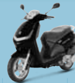
Noir Nacré (NK) 125