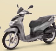
Dark Grey (N6) 125 • 200i