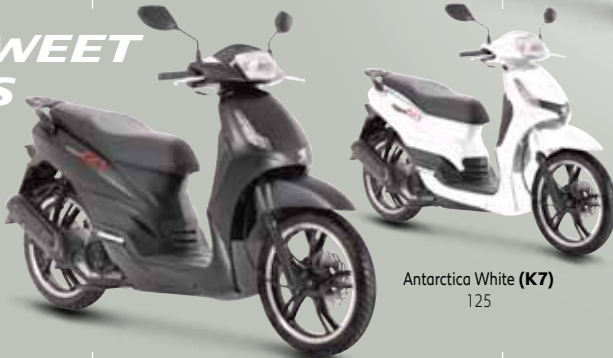
Ebony Black (K4) 125