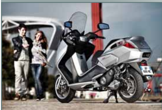
Gris Quartz (J1) 125