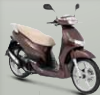
Chesnut (J7) 125