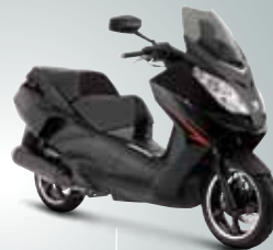
Noir mat • Noir nacré (N1) 125

versions disponibles : 125 Premium / Executive