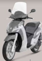
Gris Quartz (J1) 125 • 300 • 400