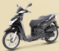
Asphalt Black (K6) 125 • 200i