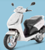
Icy White (F8) 125