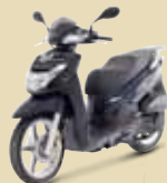
Ink Blue (N5) 125 • 200i