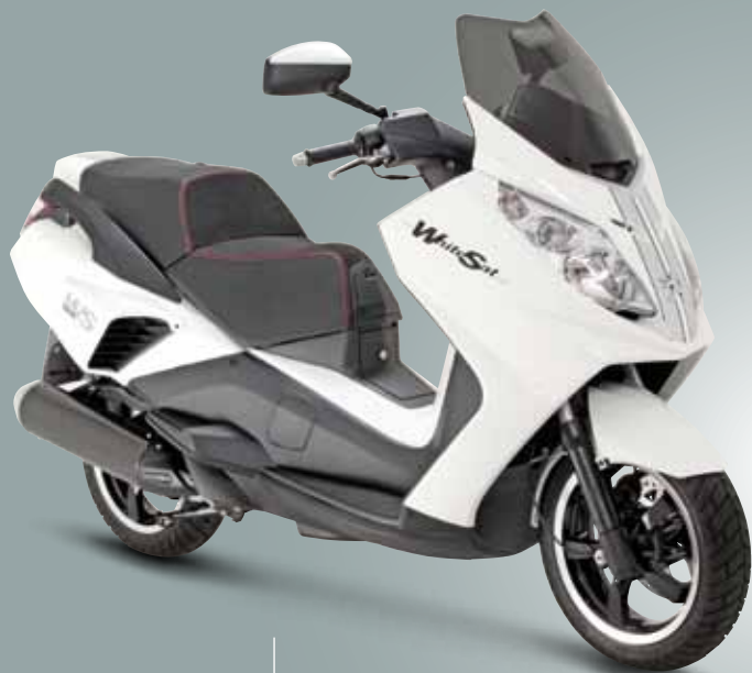
Blanc Neige (BL) 125