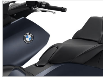
Ozeanblau metallic matt NOM / Sitzbank schwarz *2