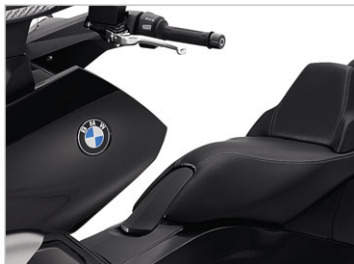
Blackstorm metallic ND2 / Sitzbank schwarz